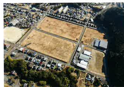
分譲中の入来工業団地 (令和4年1月撮影)