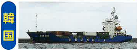
《 船 社 》

【興亜LINE株式会社】(韓国) HEUNG - A LINE CO.,LTD.