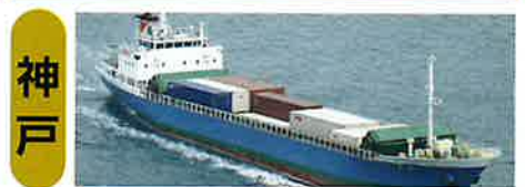
《 船 社 》

【中越物産株式会社】 〒899-1924 鹿児島県薩摩川内市港町字松原360-21 TEL (0996) 26-3335 FAX (0996) 26-3310