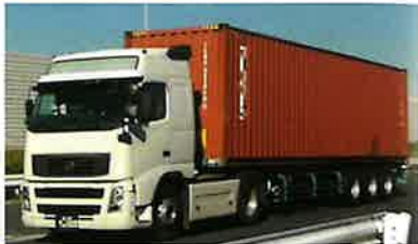
国際海上コンテナ車(40ft背高)