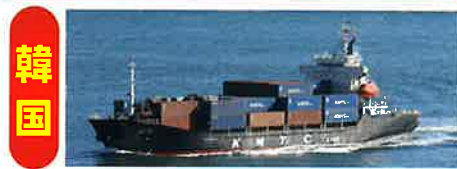
《 船 社 》

【日本通運株式会社 川内支店 川内海運事業所】 〒899-1924 鹿児島県薩摩川内市港町 360-16 TEL : 0996-31-2521 FAX : 0996-31-2522