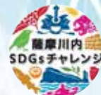
▲SDGs未来都市 薩摩川内市

〒895-8650 鹿児島県薩摩川内市神田町3番22号(薩摩川内市役所本庁3階) TEL:0996-23-5111(内線3850) FAX:0996-22-4018 E-mail:tochikai@city.satsumasendai.lg.jp