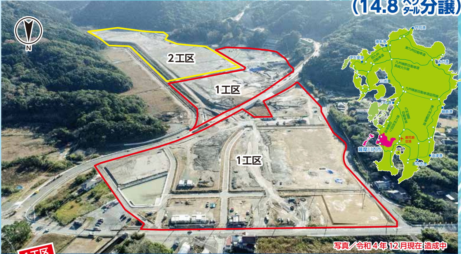
写真/令和4年12月現在(造成中)